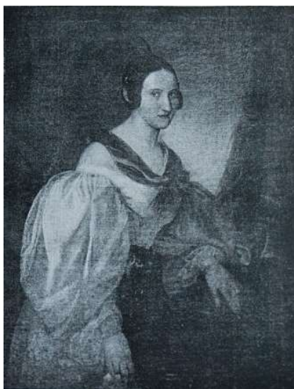
Anton Depauly: Porträt eines unbekanntes Mädchens (Reproduktion ex Ladislav Lábek: Katalog výstavy dámské módy a rod. portrétů plzeňských z XIX. století , Plzeň 1923)

Das allerletzte Zeugnis der Existenz des Malers Anton Depauly befindet sich in der Sterbematrize von Stříbro: Ein tragischer Tod beendete sein Leben am 28. April 1866. 28